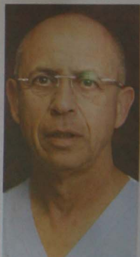
פרופ' עוזי בלר, מומחה בגינקולוגיה כירורגית ואונקולוגיה, המרכז הרפואי שערי צדק