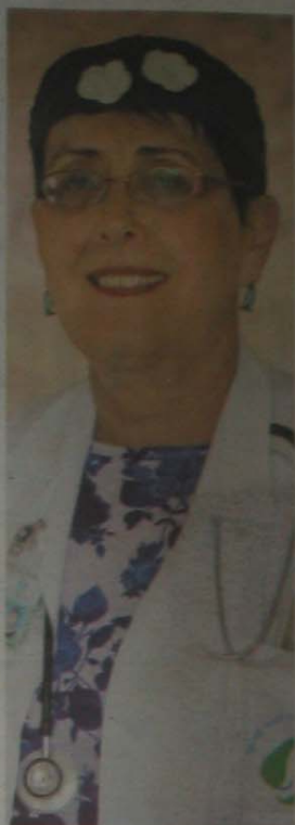
פרופ' דבורה ליברמן, מומחית בגריאטריה ובמחלות פנימיות, המרכז הרפואי סורוקה