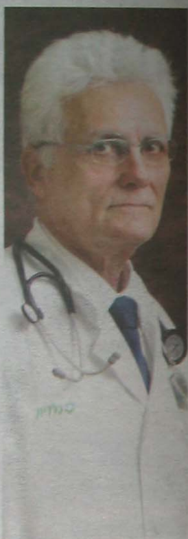
פרופ' יצהל בנדר, מומחה ברפואה פנימית ובגריאטריה, המרכז הרפואי מאיר