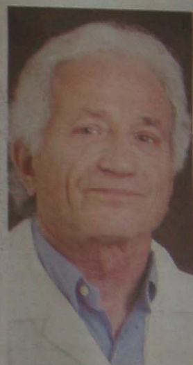
פרופ' שוקי דור, מומחה בפרייה הפריה חוץ-גופית וניתוחים גינקולוגיים, המרכז הרפואי שיבא, תל השומר